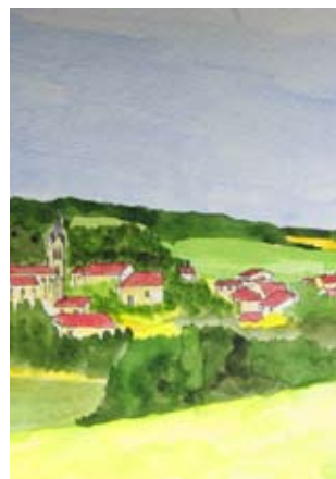
Montignac de Lauzun

Sur ce circuit, découvrez comment les constructions révèlent le paysage environnant.